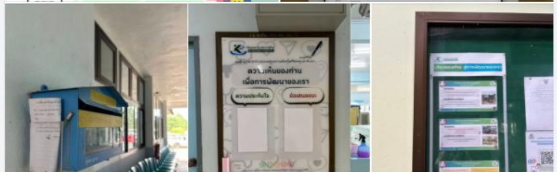
โรงพยาบาลเขาสุกิม